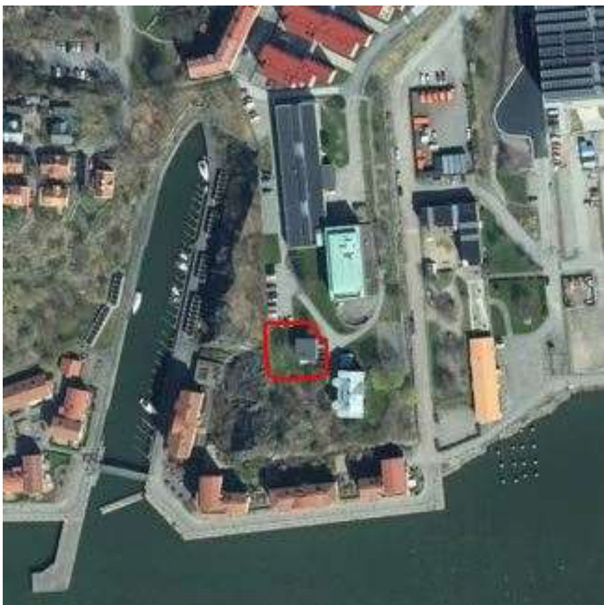
Figur 1. Aktuell fastighet markeras med röd polygon.

PEAB Bostad är innehavare av fastigheten som är placerad ovanpå Skateberget, där planen är att uppföra en byggnad med cirka 30 lägenheter. I nära anslutning till fastigheten ligger tre bergslänter, två betongstödmurar samt en contrefor. Inuti Skateberget ligger även ett bergrum.