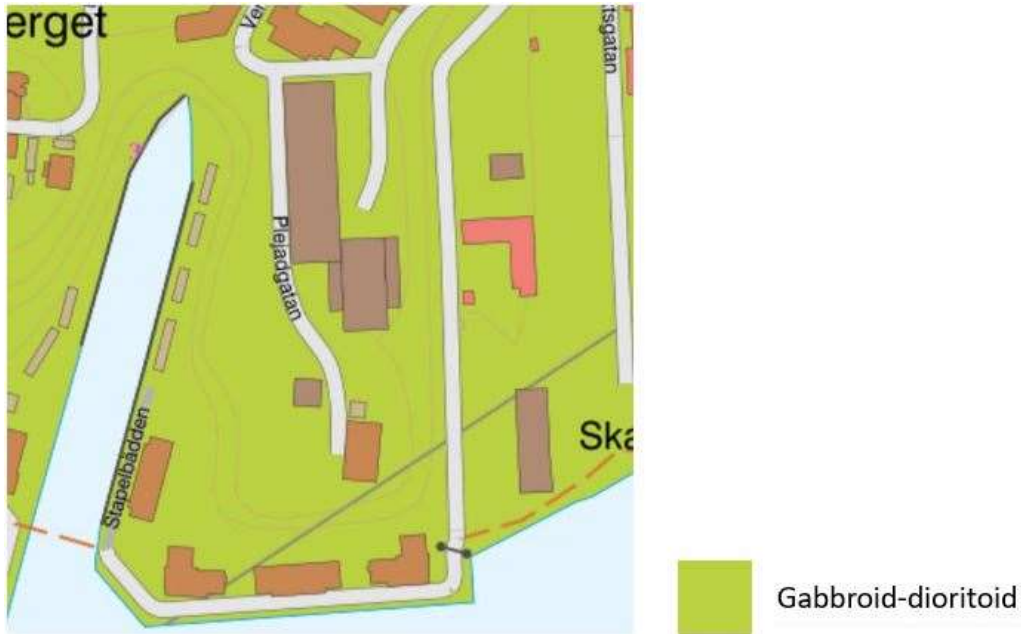
Figur 2. Utdrag från SGU:s berggrundskarta, visar på Gabbroid-dioritoid i planområdet.

Berggrunden inom undersökningsområdet utgörs huvudsakligen av en granodioritisk-tonalitisk gnejs som bitvis är ögonförande och har ett relativt högt glimmerinnehåll. Observerad berggrund inom Lindholmen 6:11 består av metabasit. Förekommande sprickor är generellt täta till något öppna. Sprickytor är plana eller undulerande samt släta till råa.