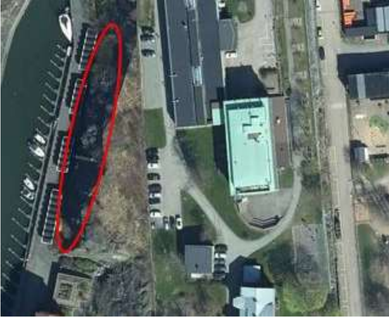
Figur 10. Området där blocknedfall riskerar att skada sjöbodar markeras med röd oval.