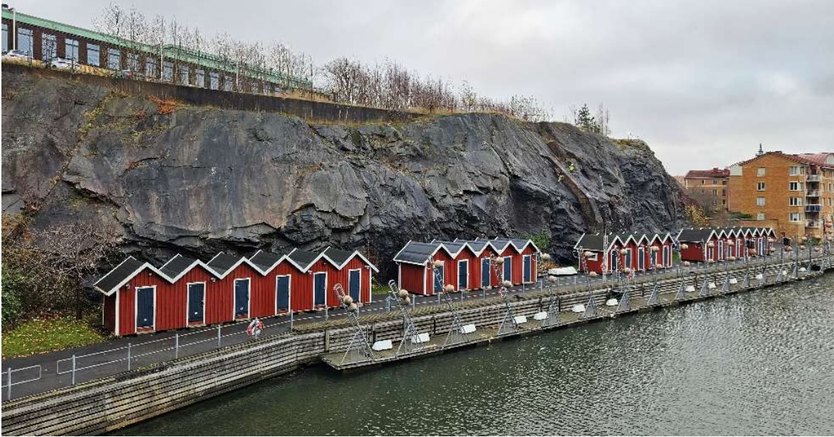
Figur 6. Bergslänt samt stödmur och contrefor i delområde 3.