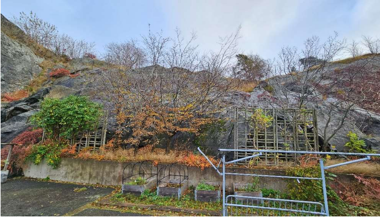
Figur 8. Bergslänt direkt intill/under grundläggningsytan.