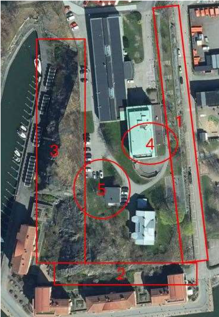
Figur 3. De fem delområden som besiktats innehållande berg- och betongkonstruktioner, områdena har markerats med röda figurer.