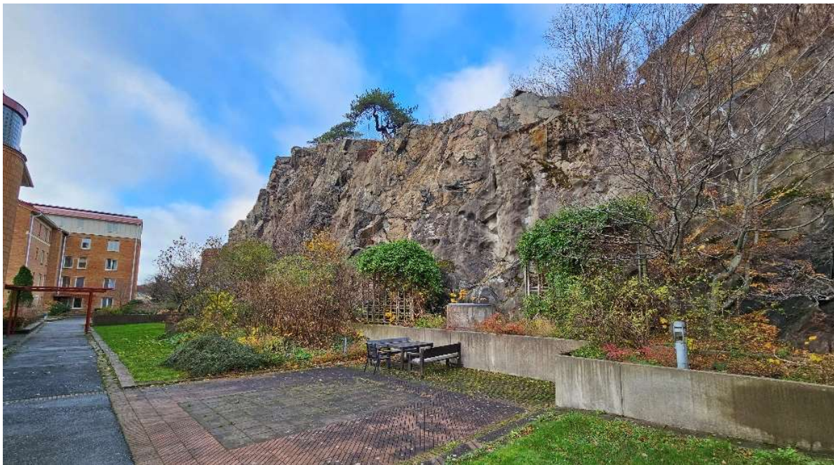
Figur 5. Bergslänt från delområde 2.

I området finns en hög bergslänt som löper i Ö-V riktning (se Figur 5). Mellan bergslänt och gångyta finns en bredare rabatt. I bergsläntens östra del finns gammal sprutbetong. Under 2021 har bergförstärkningsarbete utförts i bergslänten och den bedöms vara i mycket gott skick.