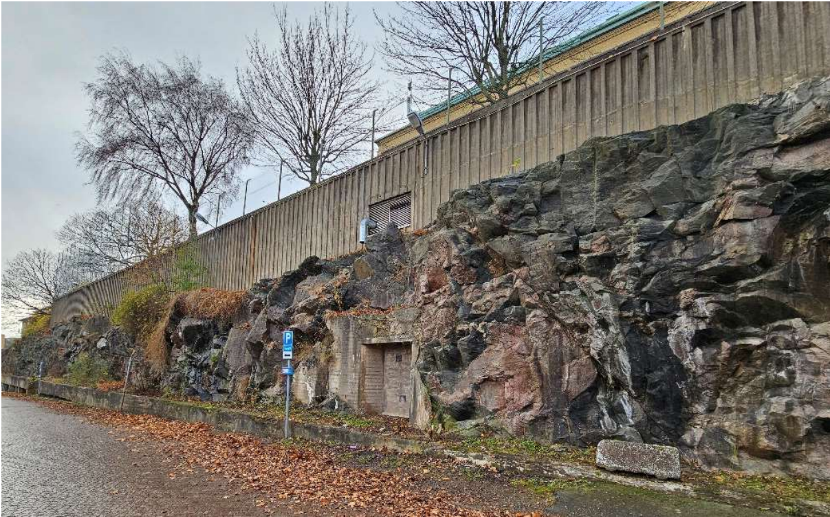
Figur 4. Bergslänt samt stödmur i delområde 1