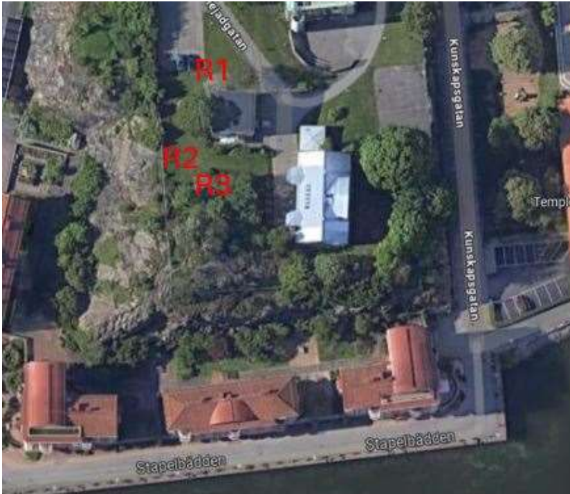
Figur 9. Mätpunkternas ungefärliga läge i markeras med R1-R3.

Uppmätta värden visar aktivitetskoncentrationer från radium-226 på mellan 23,5 och 27,2 Bq/kg. Mätvärden redovisas i Tabell 1.